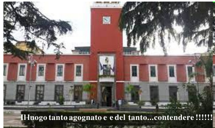
Il luogo tanto agognato e del tanto...contendere!!!!!!

La sindaca ha motivato le modifiche affermando come la politica degli anni 70 e 80 sia stata la responsabile della mala costru-